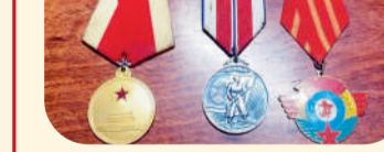
(浙农股份 周晨辉 惠多利 徐孟丘)

电影《长津湖》中,中国志愿军战士啃土豆,在零下三四十度的天气中爬雪山的场景,我爷爷都经历过。